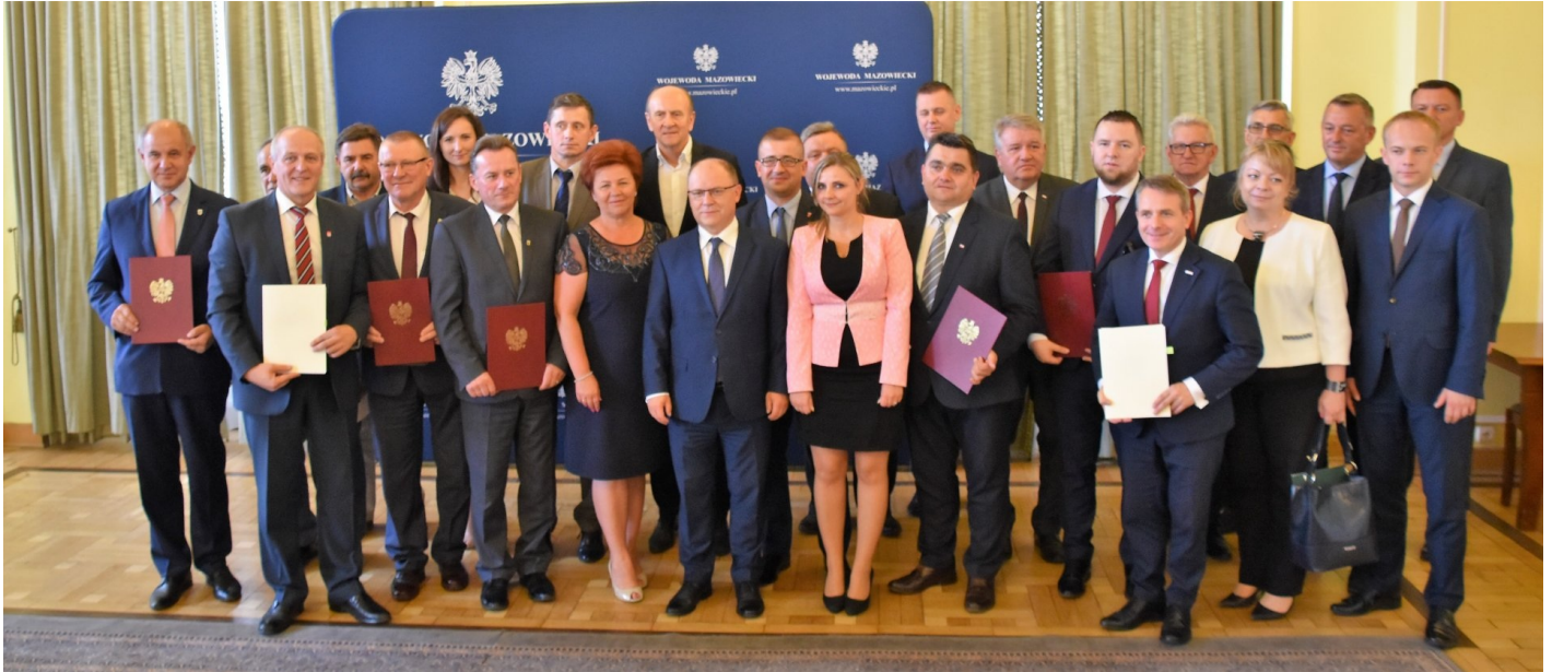
Foto: Podpisanie umów w Mazowieckim Urzędzie Wojewódzkim w Warszawie

Dotację otrzymał m.in. powiat ciechanowski na przebudowę ulicy Kwiatowej w Ciechanowie